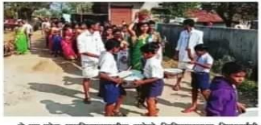
जे.एच.पटेल महाविद्यालयातील रासेयो शिबिरात दरव्यान विद्यार्थ्यांनी काढलेली हुशियेटी.

मेजर, भारतीय सीमा सुरक्षा दला ३. व्यक्तीच्या सर्वांगीण विकासासाठी राष्ट्रीय सेवा योजनेच्या शिबिराचा कायदा हाता, आत्मविश्वास वाढवणे, सामाजिकतत्वात तयार झाली, सामाजिक बांधिलकीची भजना मनात निर्माण झाली, नेतृत्व क्षमताची हिम्मत आली, संघर्ष क्षमता वाढवता येऊ शकते असे जवाबदारीची जगणी घाली, पीपी एच कोरून आत्मविश्वास वाढवणे आणि आत्म आत्मव्यक्तिता नाही तर समाजातीलही जगणी पाहिले ही शिक्षण मिळाली.