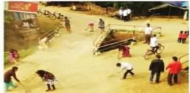
आठवले समाजकार्य महाविद्यालयाच्या रासेयो शिबिरात दरव्यान ग्रामस्वच्छता करताना विद्यार्थी.

प्रार्थना, स्वतःची कामे स्वतः करणे आणि विशेषतः घराच्या बाहेर राहून आहे त्या परिस्थितीची जुळवून घेण्याची कला उपजलच मानसाच्या अंगी येते. राष्ट्रीय सेवा योजना शिबिरातून व्यक्तीच्या सामाजिक, मानसिक, शारीरिक, बौद्धिक, राजकीय तसेच नेतृत्वगुण विकासासाठी एक-एक सुधारित पाऊल पुढे टाकले जाते आणि शिबिरातून घडले सर्वांगीण व्यक्तीत्व.