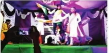
जे.एच.पटेल महाविद्यालयाच्या रासेयो शिबिरात सांस्कृतिक मुन्य सादर करताना विद्यार्थी.

हस्तशेजारी संघटित संरचना जाणून घेतली जाते. शिबिराचे नियोजन, आयोजन व अंमलबजावणी करण्याचे कौशल्य व्यक्तीच्या घाली जीवनात बहुउपयोगी पडतात. वेळेची जगणी, संवेदन क्षेत्रालय, संध्याभंगना, संघर्ष हाताळणे, सतभेद, निर्माण घेणे, मुल्यांमन अशा विविध विषयांवर प्रमुख मिळविला येते.