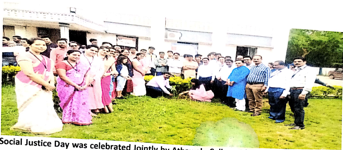
Social Justice Day was celebrated Jointly by Athawale College Of Social Work Bhandara & Assistant Commissioner Social Welfare office Bhandara at Social Justice Bhandara. Dated 26/06/2022