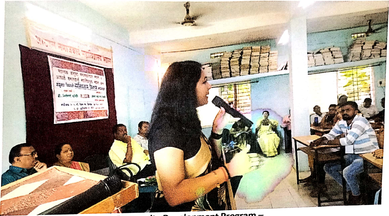
Personality Development Program –